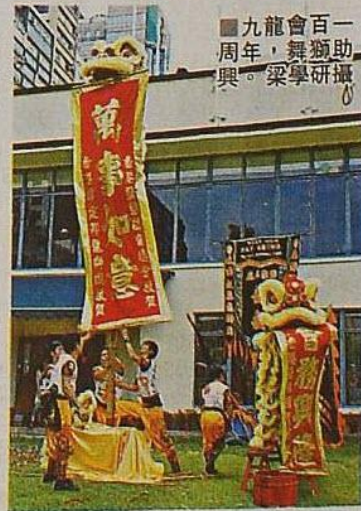
九龍會百一周年，舞獅助興。